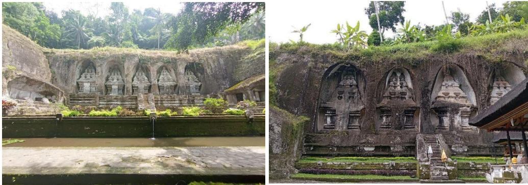
Gambar. 3 Kompleks Ceruk Pertapaan dan Candi Ke-10 Pura Gunung Kawi

Terdapat juga versi lain dari cerita bagaimana terbentuknya Pura Gunung Kawi. Menurut masyarakat yang tinggal di daerah tersebut Pura Gunung Kawi diciptakan oleh seorang yang memiliki kesaktian yang luar biasa. Orang tersebut memiliki nama Kebo Iwa. Dikatakan dalam legenda, Kebo Iwa yang memiliki kesaktian luar biasa menggunakan kuku-kukunya yang tajam dan kuat dalam memahat tebing cadas. Dinding batu cadas yang keras dipahat dengan mudahnya oleh Kebo Iwa. Dikatakan pekerjaan yang seharusnya membutuhkan waktu yang berbulan-bulan, dapat diselesaikan dalam sehari semalam saja. Situs Pura Gunung Kawi memiliki 10 candi didalamnya. Terdapat keunikan dalam 10 candi tersebut, yaitu candi ke-10 berada pada tempat yang berbeda. Lima candi berada pada tebing di sebelah timur Sungai Pakerisan. Lima candi tersebut merepresentasikan tempat bersemayamnya keluarga Raja Udayana.