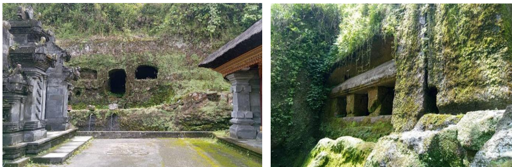
Gambar. 4 Kompleks Curuk Pertapaan dan Candi Ke-10 Pura Gunung Kawi