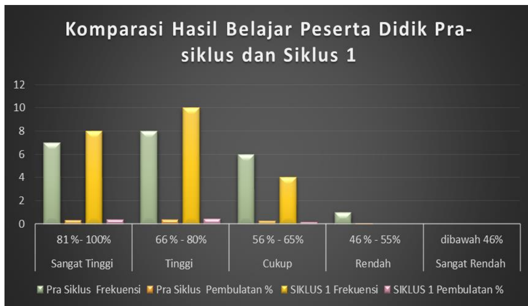
Diagram 1. Komparasi Hasil Belajar Peserta Didik

berkurang menjadi 4 peserta didik (18%), sedangkan pada kriteria prestasi rendah mengalami penurunan pada pra-siklus berjumlah 1 peserta didik (5%), pada siklus 1 berjumlah 0 peserta didik (0%). Pada kriteria hasil belajar peserta didik sangat rendah tidak mengalami peningkatan ataupun penurunan karena tidak ada peserta didik yang berada dibawah 46, pada pra-siklus berjumlah 0 peserta didik (0%) menjadi 0 peserta didik (0%).