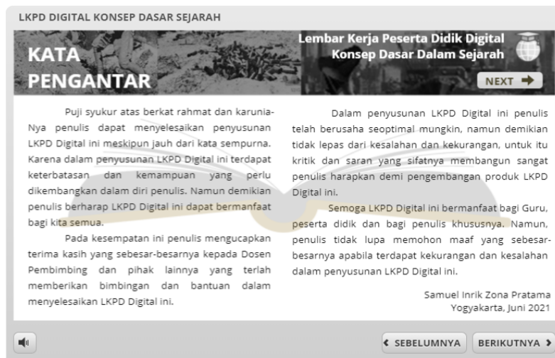
Gambar 3. Laman kata pengantar