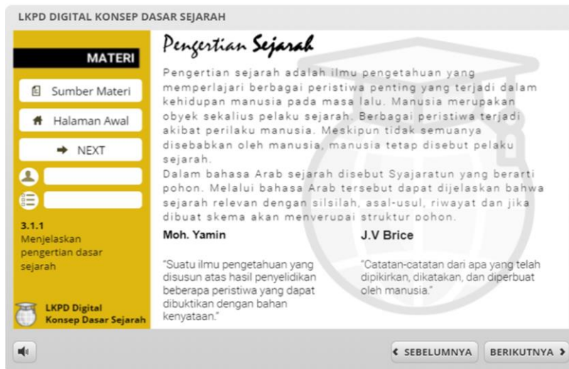
Gambar 6. Laman penyampaian materi