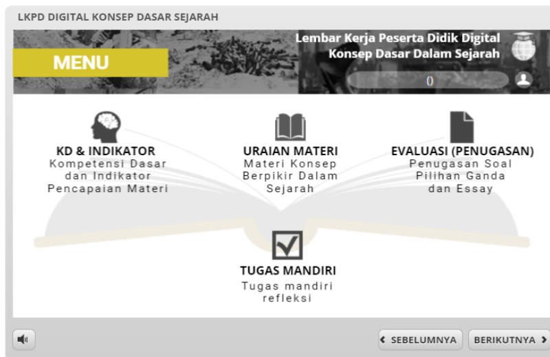
Gambar 4. Laman Menu awal