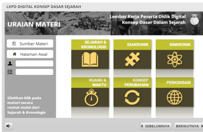
Gambar 5. Laman Uraian materi