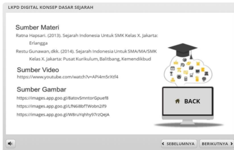
Gambar 7. Laman Sumber materi