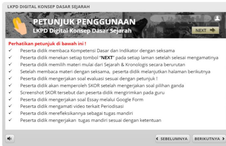
Gambar 2. Laman petunjuk penggunaan LKPD Digital