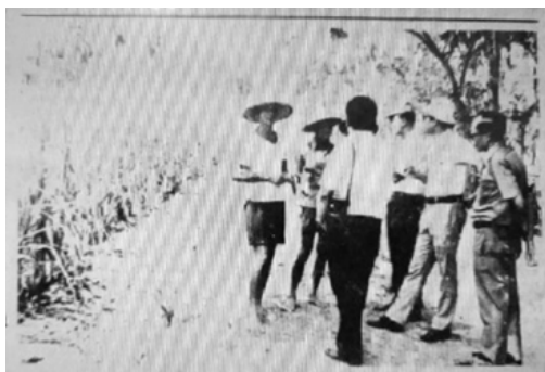
Gambar 3: Petani penggarap TRI di Ngimbang, Pendowoharjo, Sewon berdialog dengan sinder

Peran KUD sebagai pengelola TRI setiap desa mengharuskan hubungan KUD dengan petani berjalan baik, dikarenakan komunikasi yang kurang baik akan menghambat dinamika petani dalam mengelola tebu, hingga berujung pada kerugian. Hal tersebut seperti yang dialami oleh KUD "Tani Bhakti", Sewon. Pada musim tanam 1981-1982, kalurahan setempat terlambat dalam pendaftaran areal tanah ke KUD, serta kurangnya perhatian terhadap keamanan tebu, yang oleh KUD, kesalahan tersebut dilimpahkan kepada petani (Koran Kedaulatan Rakyat , 2 April 1983: 3). Sementara itu, kemajuan justru dialami oleh KUD Taniharjo, Pandak, dimana kesadaran petani untuk turut berpartisipasi dalam program TRI tumbuh kembali, setelah sebelumnya enggan menyerahkan sawahnya untuk ditanami tebu (Koran Kedaulatan Rakyat , 6 Juni 1985: 3).