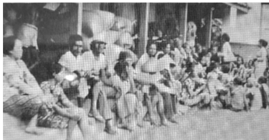
Gambar 4: Petani-petani Godean yang sedang menunggu penyerahan gula sebagai ganti sewa tanah kepada PG. Madukismo