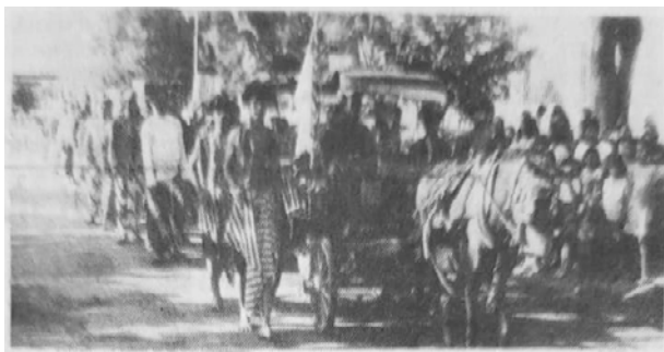
Gambar 6: Karnaval Tebu Mantan tahun 1988