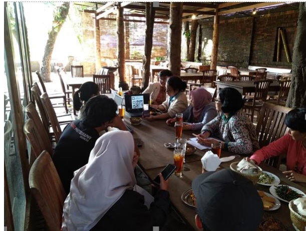
Gambar 1. Dokumentasi Pelaksanaan Diskusi Persiapan Tim PkM dengan Pengelola Desa Wisata

Mulai bulan Desember 2023 sampai Maret 2024, dilakukan pengembangan aplikasi AR yang didasarkan pada hasil analisis kebutuhan yang sudah dilakukan. Prototipe awal hasil pengembangan aplikasi AR kemudian disosialisasikan secara terbatas kepada pengelola desa wisata bersama dengan pelaku UMKM, seperti terlihat pelaksanaan kegiatannya di Gambar 2.