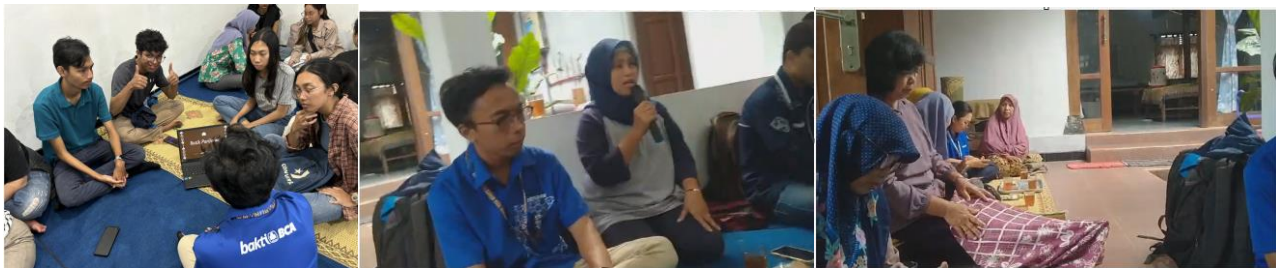
Gambar 2. Dokumentasi Pelaksanaan Sosialisasi Produk AR kepada Pelaku UMKM dan Pengelola Desa

Mulai bulan Desember 2023 sampai Maret 2024, dilakukan pengembangan aplikasi AR yang didasarkan pada hasil analisis kebutuhan yang sudah dilakukan. Prototipe awal hasil pengembangan aplikasi AR kemudian disosialisasikan secara terbatas kepada pengelola desa wisata bersama dengan pelaku UMKM, seperti terlihat pelaksanaan kegiatannya di Gambar 2.