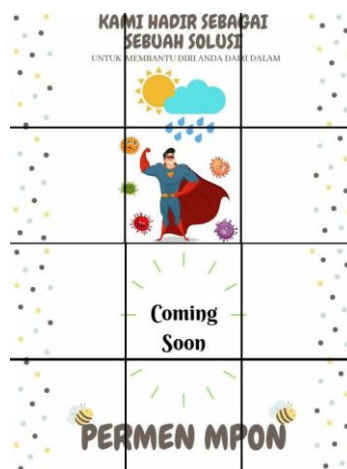
Gambar 2. Teaser launching Mpon Sehat