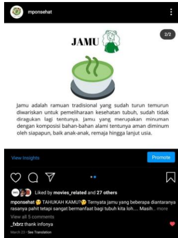
Gambar 3. Salah satu post tentang manfaat jamu