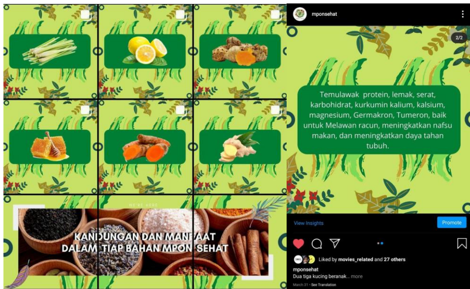
Gambar 4 dan 5. Postingan tentang manfaat dari bahan Mpon Sehat