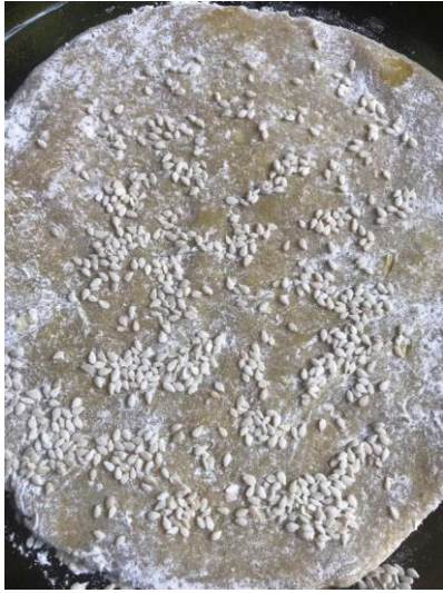
Gambar 7. Cuplikan video tutorial pembuatan permen Mpon Sehat.