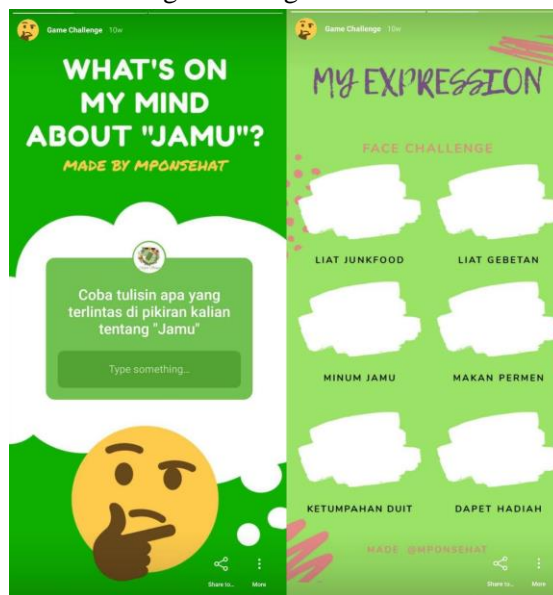
Gambar 5 dan 6. Kuis Mpon Sehat