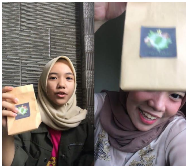
Gambar 9. Cuplikan video pendapat orang yang telah mencoba permen Mpon Sehat