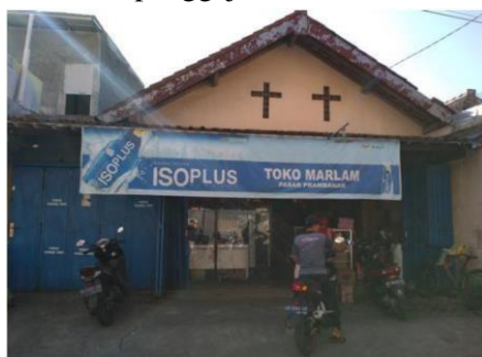
Gambar 1. Toko Marlam

Kegiatan pengabdian ini dilakukan dalam 5 kali tatap muka terjadwal pada periode Maret 2019 hingga Juli 2019. Selain kegiatan tatap muka tersebut, tim pengabdian juga melakukan kegiatan pendampingan melalui bantuan teknologi media sosial. Pada tahap pertama kegiatan pengabdian dilakukan observasi untuk melihat kondisi Toko Marlam sekaligus melakukan identifikasi proses bisnis yang telah dijalankan oleh Toko Marlam. Proses bisnis yang terjadi di Toko Marlam meliputi transaksi penjualan secara tunai, transaksi pembelian secara tunai dan kredit, serta aktivitas penggajian.