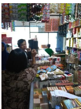
Gambar 2. Situasi di dalam Toko Marlam

Transaksi penjualan dimulai ketika pelanggan melakukan pemesanan barang kepada karyawan yang bertugas. Berdasarkan hasil observasi, kondisi Toko Marlam belum memungkinkan untuk membangun SIA secara holistik sehingga pengembangan dilakukan secara bertahap. Kegiatan pengabdian ini dilakukan sebagai tahap awal dari pengembangan SIA.