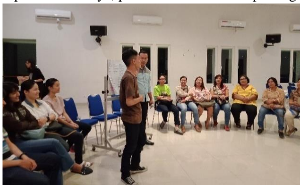
Gambar 2 peserta mempragakan cara berdiri di depan umum yang salah

Masih berkaitan dengan masalah kepercayaan diri, fasilitator juga menjelaskan bahwa penampilan kita menjadi cerminan kepercayaan diri kita. Kendati mengalami kegugupan maupun permasalahan personal lainnya, peserta disarankan tetap mengelola penampilannya.