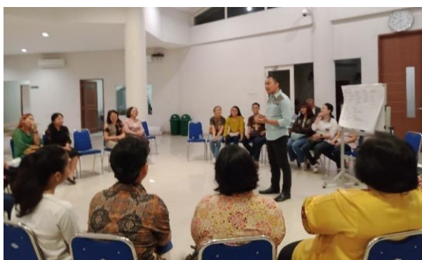
Gambar 3 Suasana pelatihan

Hal ini bertujuan untuk mengecoh publik dan untuk tampil profesional. Pengelolaan penampilan mulai dari pakaian yang digunakan, gerakan tangan, postur tubuh saat berdiri, dan gerakan badan. Pada poin pakaian yang digunakan, peserta disarankan untuk berbusana sesuai acara dan wangi. Pada poin gerakan tangan, peserta diajarkan untuk memosisikan tangan di muka dan sedikit menggerakannya ketika sedang berbicara. Sedangkan untuk poin