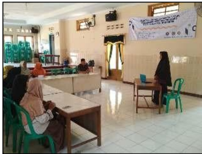
Gambar 4. Pengisian Materi Penjualan Online Pada Hari Kedua

Kami memberikan ceramah terlebih dahulu apa saja marketplace yang ada di Indonesia. Salah satu yang terbesar adalah tokopedia. Selanjutnya kami memulai pelatihan dengan memilih tokopedia sebagai marketplace untuk tempat berjualan online . Pelatihan ini dimulai dengan membuat akun tokopedia terlebih dahulu. Kemudian melengkapi data untuk memulai membuka toko online . Masyarakat cukup antusias dengan pelatihan ini. Banyak di antara mereka yang baru mengetahui tokopedia. Sehingga sangat diharapkan masyarakat terus mau untuk belajar dan bisa mengembangkan bisnis mereka.