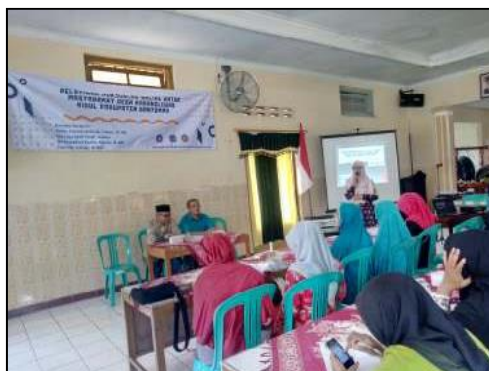
Gambar 2. Sambutan Ketua Pelaksana Pengabdian Kepada Masyarakat