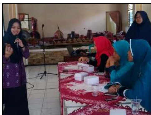
Gambar 3. Pelatihan Penjualan Online Pada Hari Pertama