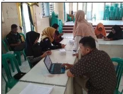
Gambar 5. Pelatihan Penjualan Online Pada Hari Kedua