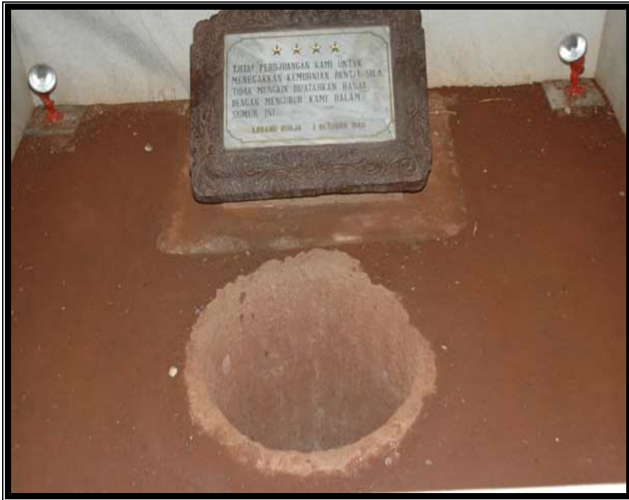
Sumur tempat jenazah para jenderal dibuang di Lubang Buaya

Meski hanya patung, tetapi karena dibuat berdasarkan kejadian nyata, tak ayal pelukisan itu sangat menyentuh perasaan yang menyaksikannya. Di areal monumen, terdapat museum. Di sini, pengunjung bisa mendengarkan riwayat singkat para jenderal yang terbunuh itu, dengan memasukan koin dan menggenggam gagang telepon di bawah foto mereka. Bagi yang ingin menonton film G-30-S PKI disediakan tempat khusus. Mereka yang ingin membaca, disediakan perpustakaan.