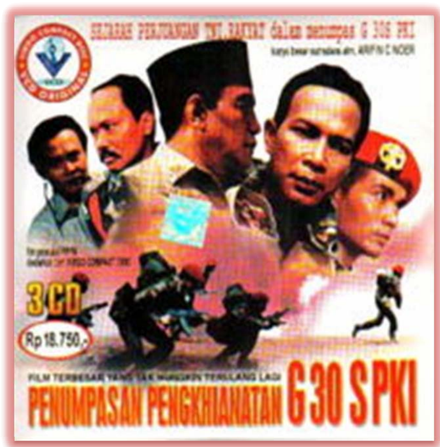
Film Penumpasan Pengkhianatan G30S/PKI Karya Arifin C. Noor

Selama regim Orde Baru, tanggal 30 September dan 1 Oktober menjadi hari-hari yang 'dikeramatkan'. Selalu ada seremoni ritual formal 12 yang dirayakan secara hikmat. Tanggal 30 September diperingati sebagai Hari G30S/PKI dan 1 Oktober sebagai Hari Kesaktian Pancasila.