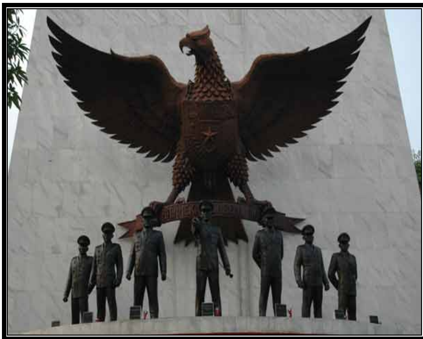
Monumen Pancasila Sakti di Lubang Buaya

Korban-korban pun berjatuhan. Sudomo, bekas menteri Koordinator Politik dan Keamanan, mengatakan, ada satu juta massa PKI yang terbunuh. Angka ini jauh lebih kecil dari perkiraan peneliti lain, yang menaksir antara dua sampai tiga juta orang. Mereka yang selamat dari pembunuhan dipenjarakan dan diasingkan ke berbagai tempat, mulai Pulau Nusakambangan (wilayah selatan Indonesia) hingga Pulau Buru (wilayah timur Indonesia). Hampir semua tahanan politik PKI, yang jumlahnya ribuan, dipenjarakan tanpa proses pengadilan. Bahkan surat penahanan pun mereka terima setelah bertahun-tahun berada di balik jeruji besi.