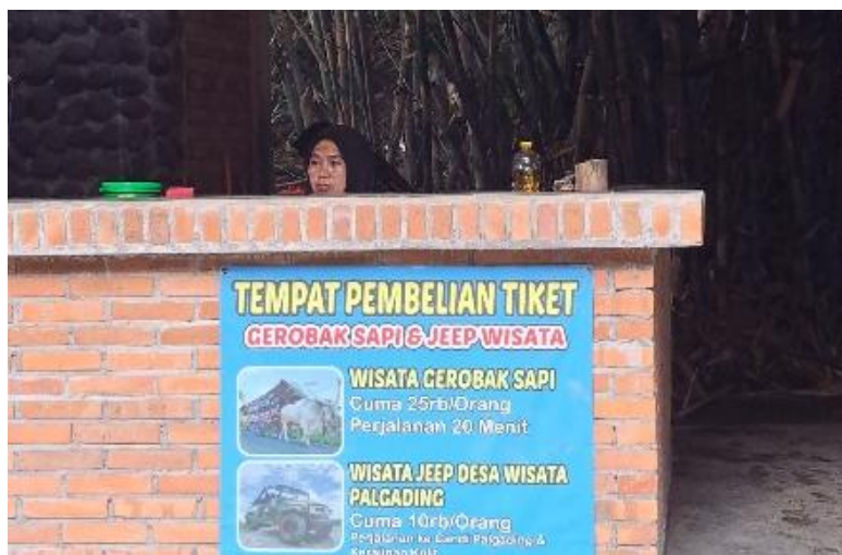
Gambar 14. Tempat Pembelian Tiket Gerobak Sapi dan Jeep Wisata di Warung Makan Sop dan Sate Sapi Pak Bayu