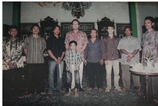
Gambar 2. Sarimaontil (paling kiri) bersama Sultan Hamengku Buwana X yang Hendak Membeli Gerobak Sapi