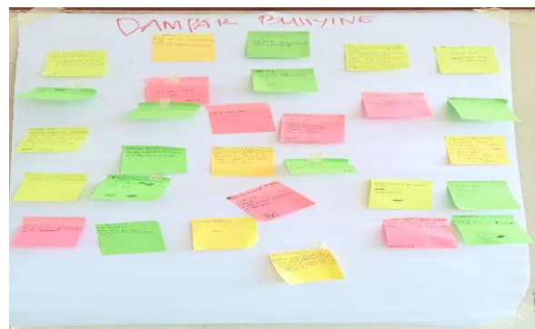
Gambar 5. Siswa Menempelkan Dampak Bullying yang Mereka Ketahui pada Sticky Notes