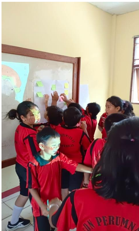
Gambar 1. Siswa Menulis dan Menempelkan Berbagai Jenis Bullying Menggunakan Sticky Notes

Brainstorming merupakan salah satu bagian penting dalam kegiatan pengabdian untuk melihat sejauh mana pemahaman siswa SD Inpres Perumnas IV Kota Jayapura ini terkait bullying . Dari hasil brainstorming , ternyata dari keseluruhan siswa, hanya dua orang yang mengetahui tentang jenis bullying itu dalam bentuk kekerasan fisik, verbal, serta kekerasan cyber (kekerasan melalui media sosial). Sementara yang lainnya hanya mengetahui bahwa bullying adalah kekerasan fisik seperti dipukul, ditendang, dilukai menggunakan benda tajam, atau dengan mendorong hingga temannya jatuh dan terluka. Pada sesi ini, siswa-siswi cukup bersemangat dan antusias menyampaikan ide dan gagasan mereka. Dengan demikian, pengabdian meminta mereka untuk menuliskan segala bentuk bullying yang mereka ketahui dalam bentuk apapun di sticky notes warna warni kemudian ditempelkan di kertas koran yang sudah ditempelkan pada papan tulis.