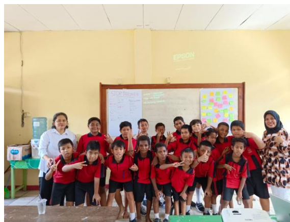
Gambar.7 Foto Bersama setelah Kegiatan

Setelah melaksanakan kegiatan pengabdian di SD Inpres Perumnas IV Kota Jayapura, hasil kegiatan disampaikan kepada pihak guru sebagai bahan evaluasi sekolah ke depan, terutama dalam penanganan kasus-kasus bullying yang terjadi di lingkungan sekolah, Meskipun memang belum pernah terjadi kasus bullying yang ekstrim, tapi paling tidak sekolah juga perlu memperhatikan proses penanganan yang lebih baik agar tercipta suasana belajar yang lebih nyaman dan kondusif bagi setiap siswa.