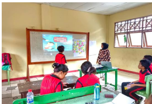
Gambar 4. Siswa Maju untuk Bercerita Tentang Kasus Bullying yang Pernah Dia Lakukan