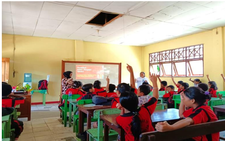
Gambar 2. Interaksi Pengabdian dan Siswa selama Proses Penyampaian Materi

setiap materi yang disampaikan sehingga setelah tiba pada materi jenis-jenis bullying mereka secara bersama-sama menyampaikan bahwa ternyata mereka semua sudah pernah melakukan tindakan bullying kepada temannya meskipun hanya dalam bentuk verbal, yaitu mengumpat temannya dengan kata-kata yang buruk yang menyebabkan temannya marah dan terluka perasaannya.