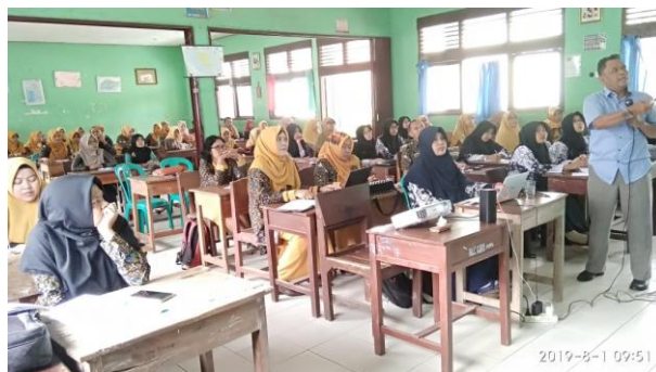
Gambar 1. Pemaparan materi oleh Ketua Tim Pengabdian

teknis berupa pembekalan pengetahuan mengenai pengintegrasian tanggap bencana pada pembelajaran melalui perangkat pembelajaran yang dibuat oleh guru.