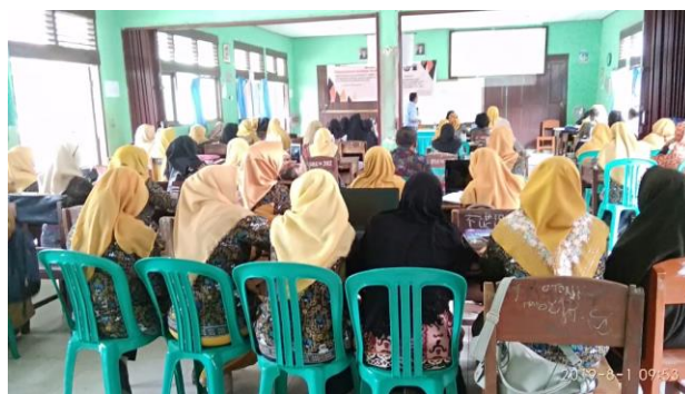
Gambar 5.2. Guru melakukan diskusi pemetaan analisis Ki dan KD

Pada tahap ini, pemateri membagikan SKL dan guru diminta untuk melakukan pemetaan dan analisis KI dan KD dengan bimbingan pemateri serta draft perangkat pembelajaran (Gambar 2).