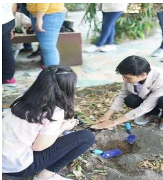
Gambar 6. Praktik Langsung Penanaman Tanaman Obat Anti-Diabetes (Sambiloto dan Stevia)

Selanjutnya peserta melakukan monitoring tanaman obat anti-diabetes yang sudah ditanam (dalam kegiatan ini yaitu tanaman sambiloto dan tanaman stevia).