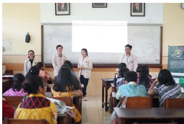
Gambar 2. Penyuluhan Tentang Diabetes Melitus dan Pengenalan Berbagai Tanaman Obat Anti-Diabetes

Setelah pemberian materi, dilanjutkan dengan diskusi interaktif dua arah yang bertujuan agar peserta dapat aktif belajar dengan kegiatan diskusi dan tanya-jawab.