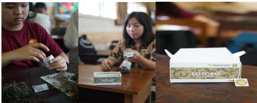
Gambar 9. Pengolahan Produk Minuman Anti-Diabetes LOTOVIA

Hasil akhir dari pengabdian yaitu dapat menyalurkan informasi, edukasi dan kegiatan positif terkait pencegahan diabetes melitus kepada masyarakat lainnya. Dalam hal ini, tim PKM-M LOTOVIA menanyakan kesan dan pesan kepada beberapa siswa terkait pelaksanaan kegiatan PKM-M ini. Mereka mengatakan bahwa “dalam kegiatan ini kami menjadi lebih tahu tentang penyakit diabetes melitus; kegiatan menanam tanaman obatnya seru; kami menjadi lebih tau tentang tanaman obat anti-diabetes, khususnya tanaman sambiloto dan stevia sebagai pencegahan untuk penyakit diabetes; dalam kegiatan sudah ditampilkan video mengenai prosedur tentang cara penanaman obat yang baik dan benar sehingga memudahkan kami dalam proses penanaman tanaman obatnya; dalam kegiatan ini kami juga diajarkan tentang pembuatan produk LOTOVIA sebagai minuman anti-diabetes”.