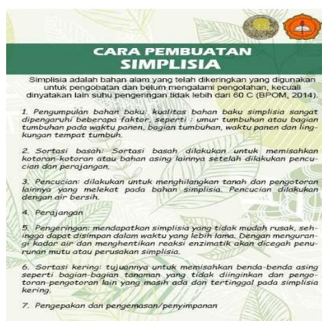
Gambar 8. Leaflet Pembuatan Simplisia Daun Sambiloto dan Simplisia Daun Stevia

Kegiatan berikutnya yaitu pemberian leaflet tentang cara pembuatan simplisia daun sambiloto dan simplisia daun stevia serta bersama tim PKM-M LOTOVIA melakukan pengolahan tanaman obat anti-diabetes menjadi produk minuman anti-diabetes LOTOVIA yang berisi produk olahan simplisia daun sambiloto dan simplisia daun stevia yang akan menjadi produk unggulan bagi SMP Pangudi Luhur 1 Yogyakarta.