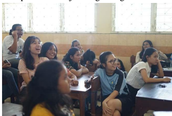
Gambar 3. Diskusi dan Tanya Jawab

Setelah pemberian materi, dilanjutkan dengan diskusi interaktif dua arah yang bertujuan agar peserta dapat aktif belajar dengan kegiatan diskusi dan tanya-jawab.