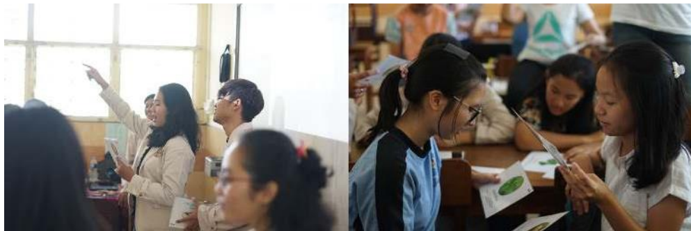
Gambar 5. Bermain dan Belajar dengan LOTOVIA smart card

Kegiatan selanjutnya para peserta diminta bermain dan belajar dengan LOTOVIA smart card bersama tim PKM-M LOTOVIA dengan tujuan agar memiliki gambaran untuk lebih memahami materi yang disampaikan khususnya mengenai tanaman obat anti-diabetes.