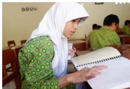
Gambar 2. Edukasi dengan modul pembelajaran

Diskusi dan sharing terkait materi edukasi yang telah disampaikan dilakukan dengan membagi siswa menjadi beberapa kelompok. Kegiatan ini bertujuan agar proses pembelajaran menjadi lebih interaktif sehingga siswa dapat saling bertukar informasi. Sebelum pemateri menarik kesimpulan dari edukasi yang sudah diberikan pada hari itu, siswa diminta untuk menemukan sendiri kesimpulan dan manfaat dari apa yang sudah dipelajari.