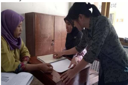
Gambar 4. Pelatihan guru

Pelatihan ini bertujuan untuk menyampaikan informasi terkait penggunaan media “Pakem Braille” dan modul yang digunakan dalam edukasi. Gambar 4 menunjukkan kegiatan pelatihan guru yang dilaksanakan oleh tim PKM-M. Hasil yang dicapai adalah kemampuan guru dalam penggunaan media dan modul meningkat. Hal ini dibuktikan dengan guru dapat menjelaskan kembali informasi yang telah disampaikan oleh tim PKM-M mengenai penggunaan media dan modul pembelajaran.