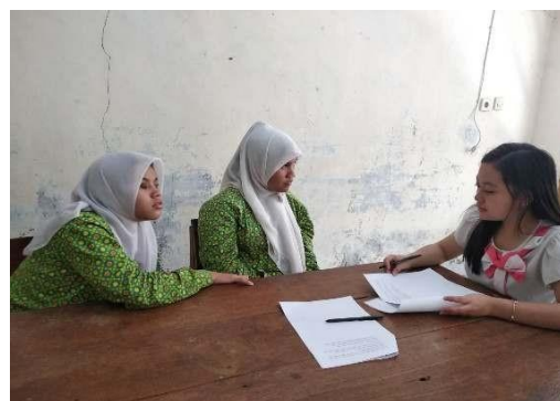
Gambar 6. Wawancara oleh tim PKM-M kepada siswa MTs Yaketunis

Berdasarkan hasil wawancara hambatan yang dialami ketika menjalankan kegiatan ini adalah saat pembagian kelompok. Hal ini dikarenakan para siswa enggan untuk berkumpul bersama dengan teman yang lain secara acak. Keengganan ini disebabkan karena kenyamanan siswa dalam proses belajar sangat dipengaruhi oleh teman yang dikenalnya, sehingga pembagian