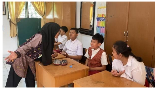
Gambar 2. Bimbingan Guru

Edukasi disampaikan melalui pendekatan edukatif-partisipatif dengan menggunakan media visual berupa gambar tubuh manusia. Pada media tersebut, peserta menempelkan sticky notes sebagai indikator bagian tubuh yang ‘boleh disentuh’ dengan tanda centang, dan ‘tidak boleh disentuh’ dengan tanda silang. Selain penyampaian materi, kegiatan ini juga dilengkapi dengan sesi ice breaking berupa menyanyikan lagu