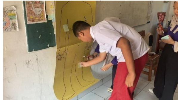
Gambar 4. Praktik Menempelkan Sticky Notes

Beberapa siswa dengan disabilitas intelektual awalnya menunjukkan keraguan, rasa malu, atau keengganan untuk berpartisipasi dalam kegiatan Pendidikan. Hal ini terlihat pada siswa dengan inisial S dan RZ, yang tampak enggan mengikuti instruksi maupun berpartisipasi aktif di awal kegiatan. Namun, melalui pendekatan personal yang menyenangkan serta perancangan kegiatan yang mempertimbangkan karakteristik masing-masing peserta, para siswa secara bertahap mulai menunjukkan partisipasi yang lebih aktif. Metode edukatif-partisipatif dengan menggunakan media visual berupa gambar tubuh manusia terbukti sesuai dan tepat sasaran bagi peserta didik berkebutuhan khusus. Pendekatan ini penting mengingat anak dengan disabilitas intelektual memiliki keterbatasan dalam memahami konsep abstrak dan memerlukan media konkret yang dapat dipersepsi secara visual dan kinestetik. Selain itu, kegiatan interaktif seperti menempelkan sticky notes pada gambar tubuh dan menyanyikan lagu disertai gerakan telah terbukti menarik perhatian peserta didik. Noer et al. (2022) juga menyatakan bahwa simulasi dengan nyanyian “sentuhan boleh sentuhan tidak boleh” dapat menjadi salah satu strategi efektif dalam pencegahan kekerasan seksual pada anak usia dini, karena membantu mereka memahami bagian tubuh mana saja yang boleh dan tidak boleh disentuh oleh orang lain.