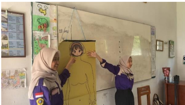
Gambar 1. Penyampaian Materi ‘Aku dan Tubuhku’

Kegiatan pengabdian kepada masyarakat berupa edukasi terkait kesehatan reproduksi bagi penyandang disabilitas dengan tema “Aku dan Tubuhku” dilaksanakan pada hari Selasa, 29 April 2025 di SLB C YPAC Palembang. Kegiatan ini bertujuan untuk meningkatkan pemahaman dasar anak penyandang disabilitas intelektual mengenai batasan fisik dan bagian tubuh mana saja yang boleh dan tidak boleh disentuh oleh orang lain. Sasaran kegiatan ini adalah siswa kelas VI yang berjumlah lima orang, terdiri dari tiga laki-laki dan dua perempuan dengan latar belakang disabilitas tunagrahita, autisme, dan Attention deficit hyperactivity disorder (ADHD).