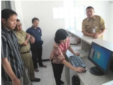
Gambar 10. Instalasi hardware dan software SIBD di PMI Kab. Magelang