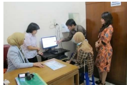
Gambar 14. Pelatihan Penggunaan SIBD di RSUD Muntilan

Hasil Pelatihan SIBD ini menunjukkan bahwa staf Laboratorium Patologi Klinik RSUD Muntilan dapat melakukan proses: