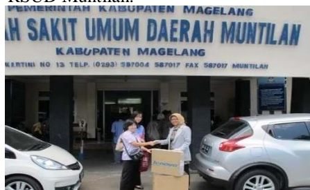
Gambar 11. Serah terima 1 set komputer kepada RSUD Muntilan