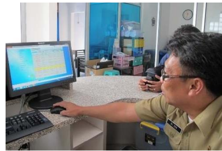
Gambar 13. Pelatihan Penggunaan SIBD di PMI Kabupaten Magelang

Hasil Pelatihan SIBD menunjukkan bahwa para staf UDD PMI Magelang dapat melakukan proses untuk :