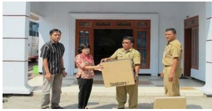
Gambar 9. Serah terima 1 set komputer ke PMI Kabupaten Magelang