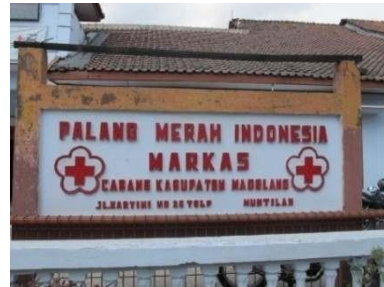
Gambar 4. Markas PMI Kabupaten Magelang

melibatkan 7 orang terdiri dari dokter Kepala Bank Darah, Kabag IT RSUD, dan 5 staf BDRS. Lama pelaksanaan proyek ini adalah 11 bulan (Februari s/d Desember 2013).