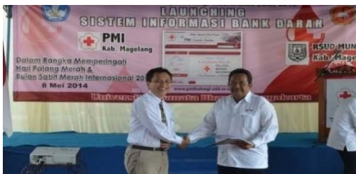
Gambar 15. Peluncuran SIBD oleh Rektor USD dan Ketua PMI Kabupaten Magelang pada tanggal 8 Mei 2014