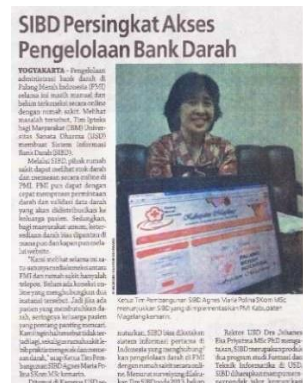
Gambar 18. Berita Peluncuran SIBD di harian SINDO (Seputar Indonesia)