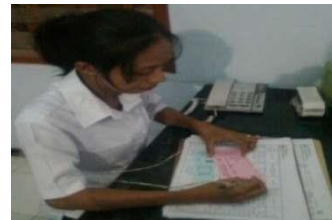
Gambar 1. Pelayanan administrasi permintaan darah di PMI Kabupaten Magelang dilakukan secara manual.

administrasi pengolahan darah, administrasi penyimpanan darah dan administrasi pendistribusian darah semuanya masih dilakukan secara manual. Akibatnya pelayanan masih lambat, yaitu rata-rata 1 s/d 2 jam dari proses permintaan darah sampai pendistribusian darah kepada keluarga pasien. Bila stok darah kosong, maka dapat memakan waktu sampai 6 jam dari proses permintaan sampai diserahkan darah kepada keluarga pasien.