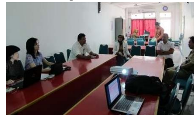
Gambar 8. Sosialisasi kepada Direktur, Dokter Pelaksana, dan staf PMI Kabupaten Magelang, serta Direktur dan staf RSUD Muntilan

Hasil pertemuan sosialisasi menunjukkan bahwa: