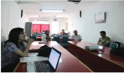
Gambar 6. Tahap Desain SIBD - Pertemuan dengan Kepala dan staf UDD PMI Kabupaten Magelang serta Kepala dan staf Bank Darah RSUD Muntilan.