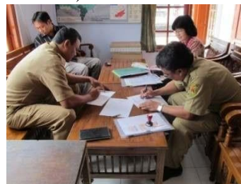
Gambar 5. Tahap Analisa Sistem SIBD - Pertemuan dengan Kepala dan staf UDD PMI Magelang