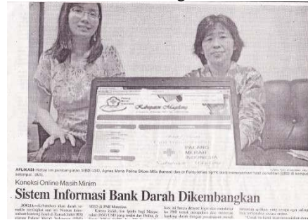
Gambar 17. Berita Peluncuran SIBD di harian Kedaulatan Rakyat