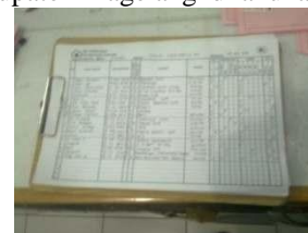
Gambar 2. Daftar Catatan Permintaan Darah