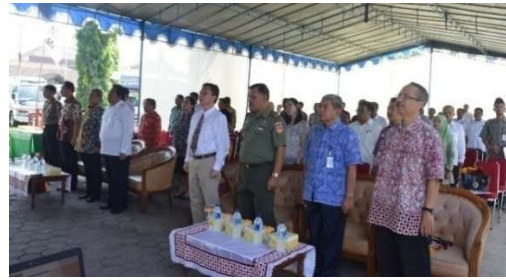
Gambar 16. Peluncuran dihadiri oleh Ketua PMI Jawa Tengah