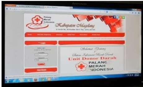
Gambar 7. Hasil Tahap Pembuatan Program ( coding ) SIBD dan Alpha Test Sistem

Hasil dari tahap Pembangunan Sistem adalah : tersedia Perangkat Lunak SIBD PMI Kabupaten Magelang, yang memiliki kemampuan :