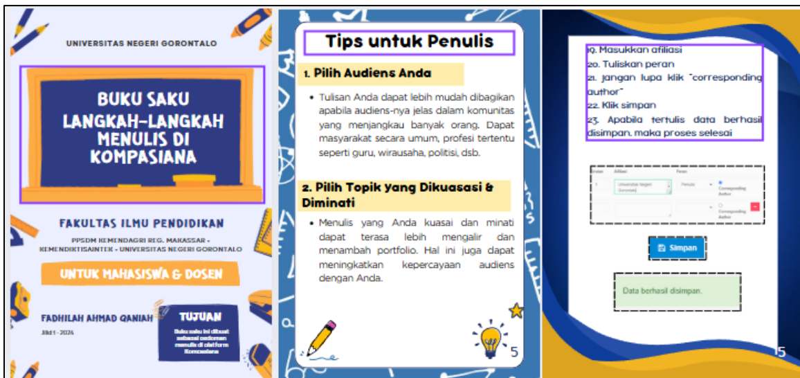
Gambar 1. Buku Saku Langkah-Langkah Menulis di Website Kompasiana

Tahap pertama adalah penyusunan buku saku panduan menulis di Kompasiana. Tahap ini dilaksanakan pada minggu pertama Oktober 2024. Buku saku ini dirancang sebagai panduan praktis yang mencakup tutorial lengkap cara membuat akun Kompasiana, mengisi biodata profil secara optimal, teknik memasukkan tulisan dengan format yang tepat, serta tips dan strategi menulis yang efektif untuk platform digital. Selain itu, buku saku juga memuat langkah-langkah detail untuk memasukkan tulisan yang telah dipublikasikan di Kompasiana ke dalam Beban Kerja Dosen (BKD) sebagai bagian dari tridarma perguruan tinggi, khususnya dalam aspek pengabdian kepada masyarakat. Penyusunan buku saku ini melibatkan tim ahli yang berpengalaman dalam menulis digital dan manajemen BKD, sehingga dapat menjadi acuan yang akurat dan mendorong akuntabilitas dosen dalam melaksanakan kewajiban publikasi ilmiah populer.