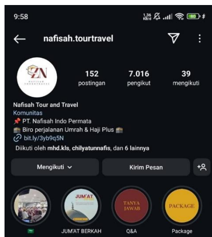
Gambar 2. Akun Instagram Nafisah Tour Travel

Tahap kedua merupakan tahap pelaksanaan yang adalah inti dari program pengabdian masyarakat, yang mana mahasiswa mengaplikasikan teori desain grafis yang telah diajarkan dalam perkuliahan. Desain grafis menurut Dewojati (2009) mempunyai 3 fungsi dasar yaitu, (1) identifikasi, (2) instruksi dan informasi, dan (3) promosi dan presentasi. Dalam tahap ini, mahasiswa diberi kebebasan untuk membuat desain konten apapun asalkan memiliki keterkaitan dengan ibadah umrah dan haji. Pengalaman langsung dalam dunia industri ini memberikan tantangan tersendiri bagi mahasiswa untuk mendorong kemampuan berpikir kreatif dan kritis dalam menghasilkan sebuah desain konten yang menarik.