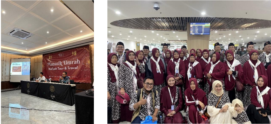
Gambar 8 dan 9. Dokumentasi Manasik dan Keberangkatan Jemaah Umrah Nafisah Tour Travel

Selain membuat konten promosi dan edukasi tentang umrah dan haji untuk feeds Instagram, mahasiswa juga berkesempatan untuk ikut berpartisipasi dalam kegiatan manasik dan pemberangkatan jemaah umrah dari Nafisah Tour Travel. Mahasiswa diberi tugas oleh direktur utama PT Nafisah Indo Permata untuk mendokumentasikan seluruh rangkaian acara manasik dan pemberangkatan jemaah umrah.