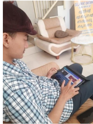
Gambar 3 dan 4. Pelaksanaan Pembuatan Desain Konten untuk Instagram