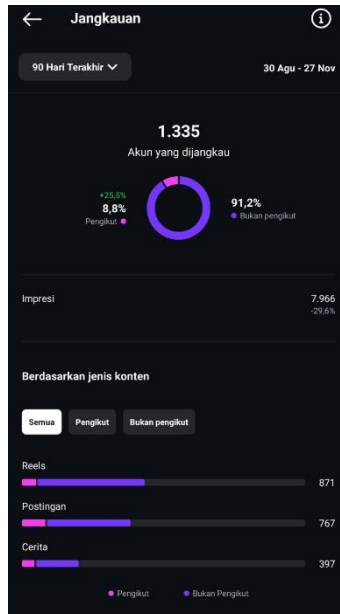
Gambar 12. Insight akun Instagram Nafisah Tour Travel

Tolak ukur kesuksesan dari digital marketing adalah saat sebuah produk atau jasa yang ditawarkan menjadi bahan pembicaraan atau telah dikenal luas oleh masyarakat. Pada gambar nomor 12 di atas yang merupakan bukti tangkapan layar halaman insight dari akun Instagram Nafisah Tour Travel, jumlah akun yang telah dijangkau selama 90 hari terakhir berjumlah 1.335 dengan 91,2 % di antaranya bukan pengikut dari Nafisah Tour Travel dan sisanya dari pengikut Nafisah Tour Travel. Ini menunjukkan indikator pencapaian dari kegiatan abdimas ini telah terpenuhi.