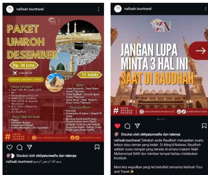
Gambar 7 dan 8. Contoh Hasil Desain Konten Promosi dan Edukasi Umrah yang Diunggah di Instagram Nafisah Tour Travel

Hasil karya yang dibuat oleh mahasiswa magang lalu diunggah di akun media sosial Instagram milik Nafisah Tour Travel. Melalui proses pengunggahan konten yang telah dibuat mahasiswa magang ini, pihak mitra dapat mengetahui bagaimana tanggapan audiens atau follower dari Nafisah Tour Travel dengan melihat dari jumlah like , comment , dan share . Hal ini juga memberikan pengalaman yang nyata bagi mahasiswa magang dalam dunia media digital.