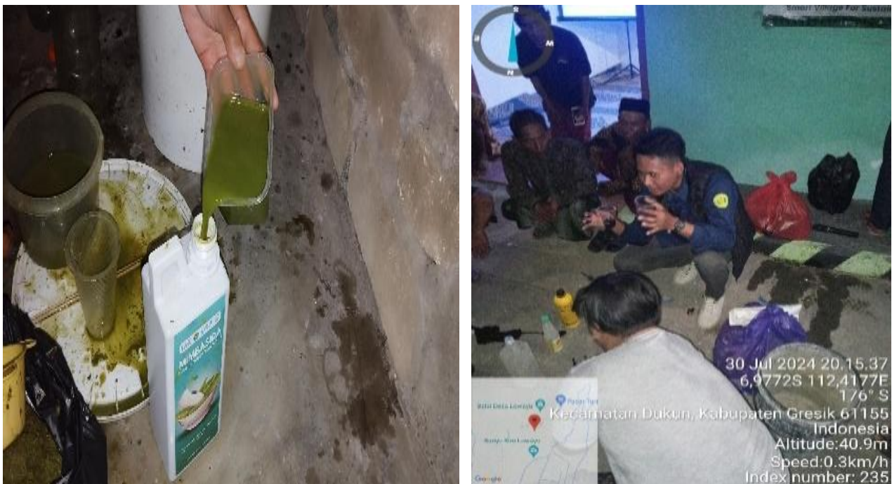
Gambar 4 & 5. Tahapan Pembuatan Pestisida Nabati

Tahapan pelatihan selanjutnya memperkenalkan alat dan bahan yang digunakan dalam praktik pembuatan pestisida nabati, yaitu daun mimba seberat 250 gram, air sejumlah 500 ml, satu butir telur, mesin pencacah, dan blender. Daun mimba berfungsi sebagai bahan utama yang mengandung senyawa aktif insektisida, antifungal, dan antibakteri untuk mengendalikan hama tanaman (Sari, et al, 2023). Air digunakan sebagai pelarut untuk mengekstrak senyawa aktif dari daun mimba dan membantu proses pencampuran agar larutan pestisida dapat diaplikasikan secara merata. Telur berfungsi sebagai pengemulsi alami, membantu larutan pestisida menempel lebih lama pada permukaan daun sehingga efektivitasnya meningkat. Blender digunakan untuk menghaluskan daun mimba dan mencampur semua bahan secara merata, sehingga senyawa aktif lebih mudah terekstrak dan larutan pestisida menjadi lebih halus. Mesin pencacah digunakan untuk memotong daun mimba menjadi bagian kecil sebelum dihaluskan dengan blender, agar proses ekstraksi senyawa aktif lebih optimal dan efisien. Kegiatan ini dapat diilustrasikan sesuai gambar berikut.