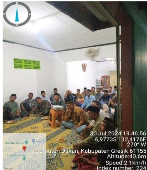
Gambar 2 dan 3. Proses Presentasi Potensi Pestisida Nabati

Peserta diberikan gambaran bahwa daun mimba sangat efektif digunakan untuk mengelola hama. Penyelenggara pelatihan menjabarkan berbagai keunggulan ekstrak daun ini. Sudartik & Yusuf (2024) dan Javandira et al. (2022) memberikan bukti empiris mengenai efektivitas ekstrak daun mimba ( Azadirachta indica ) terhadap hama isap, yaitu kutu kebul pada tanaman cabai dan kutu daun pada kacang panjang. Kedua studi ini menunjukkan bahwa mimba memiliki spektrum aplikasi yang luas dan konsisten. Pada aspek teknis, Firdaus et al. (2024) melengkapi dengan mengevaluasi tingkat pengetahuan dan adopsi petani terhadap penggunaan pestisida nabati. Manfaat yang dapat diperoleh dari ekstrak ini adalah sebagai berikut.